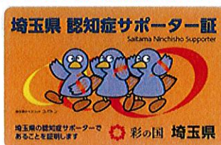
「埼玉県認知症サポーター証」表面